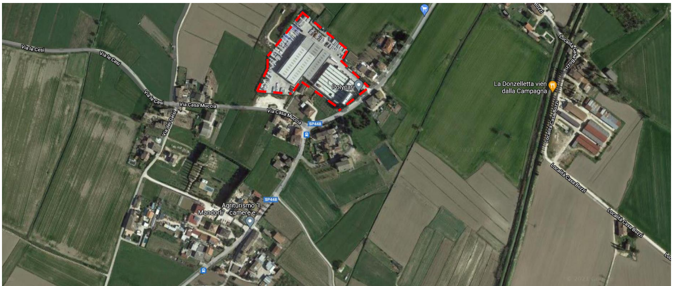
Perimetro indicativo della Polycar S.r.l.